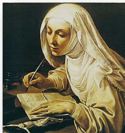
Laique dominicaine (1347-1380), contemplative et engagée apôtre de la réforme de l'Eglise : « Ma nature c'est le feu »