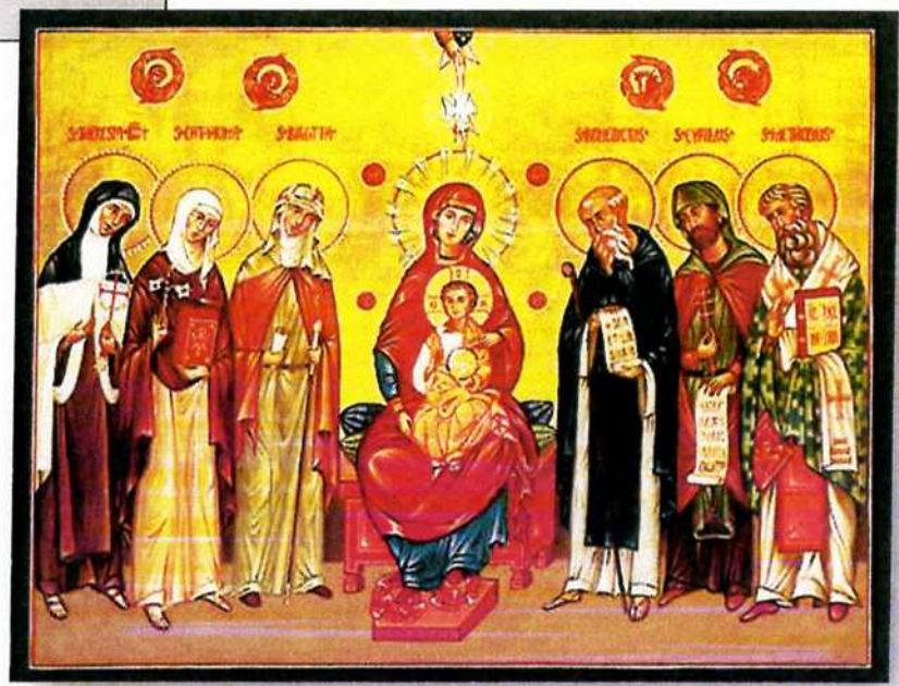
Stes Bénédicta, Catherine et Brigitte - Sts Benoît, Cyrille et Méthode